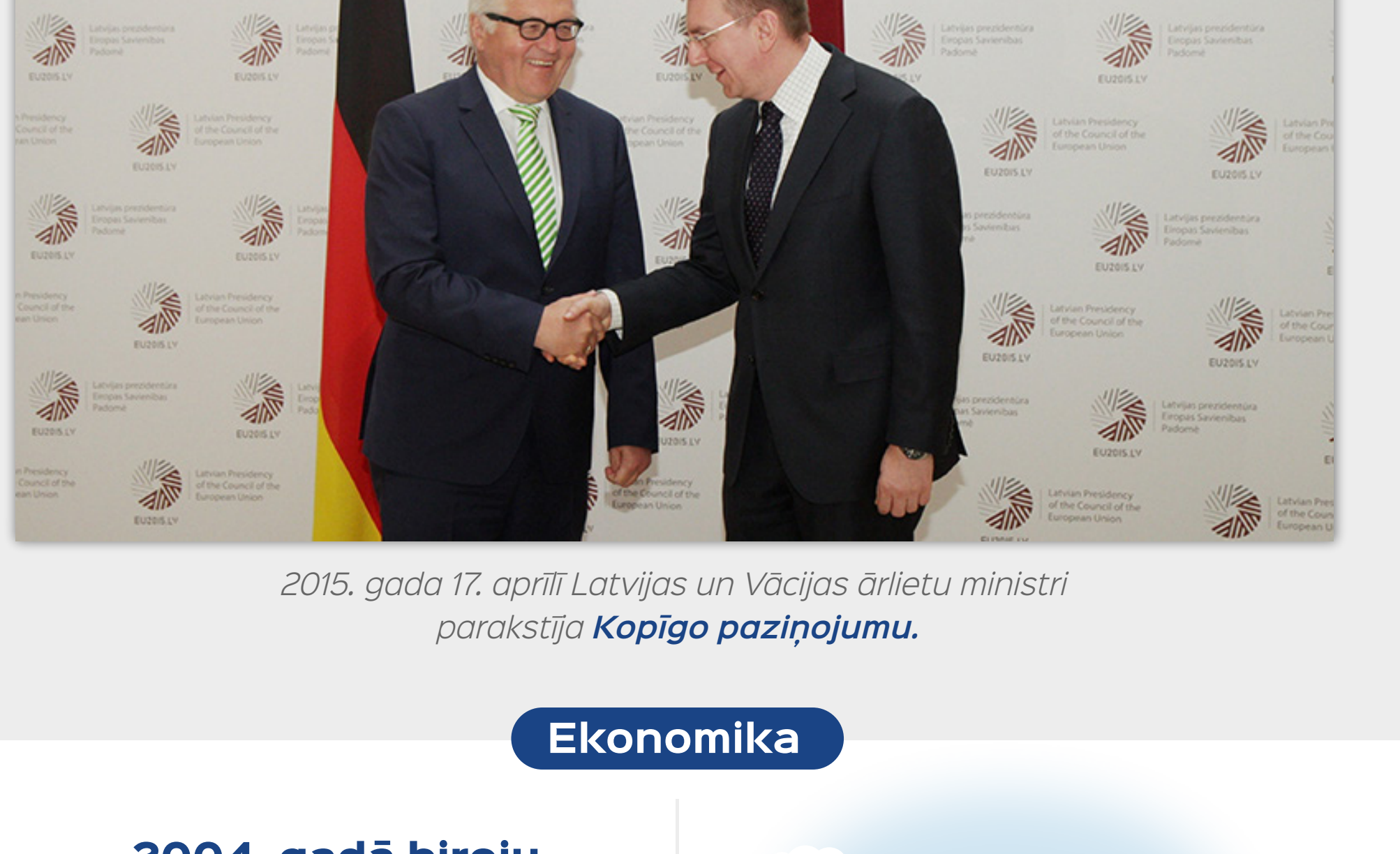
2015. gada 17. aprīlī Latvijas un Vācijas ārlietu ministri parakstīja Kopīgo paziņojumu .