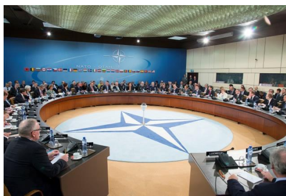
NATO ārlietu ministru sanāksme Briselē

Notikumi Ukrainā 2013. gada nogalē un 2014. gada sākumā Krievijas īstenotā agresija Ukrainā satricinājusi Eiropas drošību un globālo starptautisko kārtību. Līdz ar to šie notikumi turpmāk ietekmēs starptautiskās drošības politikas darba kārtību. Kopā ar sabiedrotajiem NATO Latvija operatīvi un efektīvi reaģēja, sperot konkrētus svarīgus soļus aizsardzības stiprināšanai visā Ziemeļatlantijas alianses teritorijā, arī Baltijas reģionā.