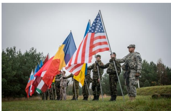
Militārās mācības „Steadfast Jazz 2013”

2013. gadā Latvija turpināja centienus stiprināt NATO kolektīvo aizsardzību un klātbūtni, kā arī transatlantisko saiti. Tā rezultātā 2013. gada novembrī Latvijā un Polijā notika pēdējos gados lielākās NATO militārās mācības „Steadfast Jazz 2013”, kuras apmeklēja arī