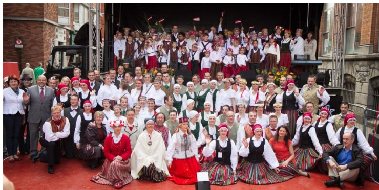
Latvijas kultūras diena Dublinā

Lai stiprinātu dialogu starp ārvalstīs dzīvojošajiem tautiešiem, Latvijas valsts iestādēm un sabiedrību, ĀM kā līdzorganizatore piedalījās ikgadējās konferences “Latvieši pasaulē – piederīgi Latvijai” rīkošanā, kas notika 1. jūlijā, vadot arī darba grupu par komunikācijas stiprināšanu starp Latvijas institūcijām un diasporas organizācijām un medijiem.