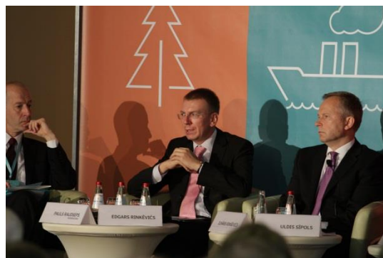
Ārlietu ministrs Edgars Rinkēvičs atklāj Pirmo Pasaules Latviešu ekonomikas un inovāciju forumu Rīgā 2013. gada 2. jūlijā

Svarīgs ārpolitikas rīcības virziens ir sadarbība ar diasporu. 2013. gada 5. martā valdība akceptēja informatīvo ziņojumu „Par Ārlietu ministrijas sadarbību ar Latvijas diasporu 2013. - 2015. gadā”, kurā noteikti rīcības virzieni un minēti konkrēti pasākumi, ko ĀM īsteno sadarbībā ar citām iesaistītajām institūcijām. Sadarbība ar diasporu būs vērsta uz diasporas politiskās un pilsoniskās līdzdalības veicināšanu, diasporas saiknes ar Latviju un latviskās identitātes saglabāšanu, sadarbības ar tautiešiem ārzemēs stiprināšanu ekonomikā, zinātnē, izglītībā un kultūrā, kā arī atbalsta sniegšanu tiem, kuri vēlas atgriezties Latvijā.