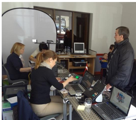
Latvijas vēstniecības Lielbritānijas uz Ziemeļīrijas Apvienotajā Karalistē mobilo pasu darbstacijas izbraukums Skotijā

2013. gadā sniegto konsulāro pakalpojumu skaits ievērojami pārsniedzis daudzus iepriekšējo gadu statistikas rādītājus. 2013. gadā pārstāvniecībās tika noformētas 21 687 pases (pieaugums par 55% salīdzinājumā ar 2012. gadu), noformētas 10 987 eID kartes (2012. gadā - 3469), 6513 atgriešanās apliecības, veiktas 1885 notariālās darbības, noformēti un pārsūtīti 25 170 dokumenti, izsniegtas 2784 izziņas. Vislielākais sniegto pakalpojumu skaita pieaugums ir Latvijas vēstniecībās Lielbritānijā, Īrijā, Krievijā un Vācijā.