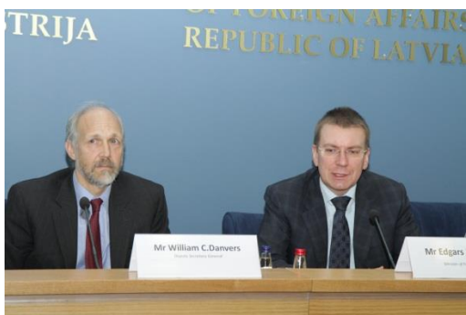
ESAO/OECD ģenerālsēdes vietnieka Viljama Denversa vizīte Latvijā 2013. gada 9. decembrī

2013. gada 30. maijā Ekonomiskās sadarbības un attīstības organizācijas (ESAO/OECD) Ministru padomes sēdē Parīzē ESAO/OECD dalībvalstis pilnvaroja organizācijas ģenerālsēdes uzskatīšanu ar Latviju par pievienošanas organizācijai. Sarunu sākšana par pievienošanas