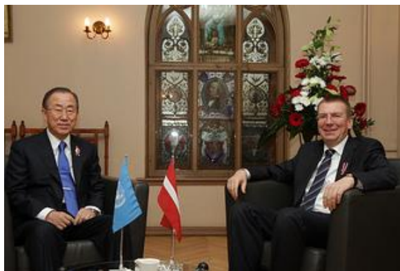
ANO ģenerālsēkretāra Bana Kimūna oficiālā vizīte Latvijā 2013. gada 14. novembrī

2013. gada 14. - 15. novembrī pirmo reizi Latviju oficiālā vizītē apmeklēja ANO ģenerālsēkretārs Bana Kimūns ( Ban Ki-moon ). Vizītes ietvaros ANO ģenerālsēkretārs uzstājās Valsts prezidenta kancelejas sadarbībā ar Latvijas Vēsturnieku komisiju rīkotajā starptautiskajā konferencē «Latvijas valsts veidošana un atjaunošana vēsturiskā skatījumā», kā arī tikās ar valsts augstākajām amatpersonām.