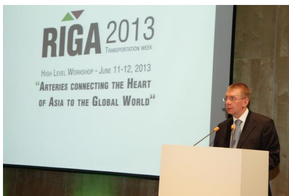
Ārlietu ministrs Edgars Rinkēvičs atklāj semināru „Transporta koridori starp Āzijas sirdi un pasauli” 2013. gada 11. jūnijā

2013. gadā notika piecas Ārējās ekonomiskās politikas koordinācijas padomes sēdes, kurās tika spriests par tādiem nozīmīgiem jautājumiem kā prioritārie tirgi Latvijas eksportētājiem, kritēriju sistēma ekonomiska rakstura vizīšu iniciēšanai un uzņēmēju dalībai valsts amatpersonu ārvalstu vizīšu uzņēmēju delegācijās, Latvijas ekonomiskā tēla popularizēšana ārvalstīs, izglītības, medicīnas un tūrisma nozares perspektīvas ārējos tirgos.