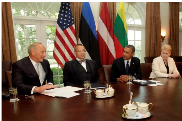
ASV prezidenta Baraka Obamas un Baltijas valstu prezidentu tikšanās Vašingtonā, 2013. gada 30. augustā

2013. gadā Latvija turpināja paplašināt dialogu ar ASV, kas ir Latvijas ciešākais sabiedrotais, galvenais stratēģiskais partneris un drošības garants. Baltijas valstu prezidentu tikšanās ar ASV prezidentu Baraku Obamu un viceprezidentu Džo Baidenu Vašingtonā