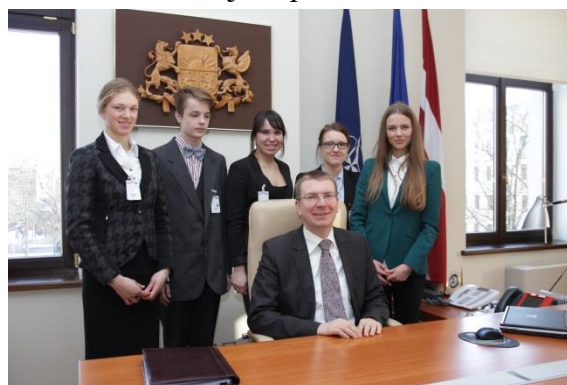
Ālietu ministrs Edgars Rinkēvičs piedalās „Ēnu dienā” 2013. gada 13. februārī

26. aprīlī Radošās darbības nedēļas „Radi!” ietvaros ĀM sadarbībā ar Latvijas institūtu organizēja semināru „Jauni komunikācijas veidi Latvijas tēla veidošanā” par radošas un informatīvas komunikācijas nozīmi valsts tēla veidošanā.