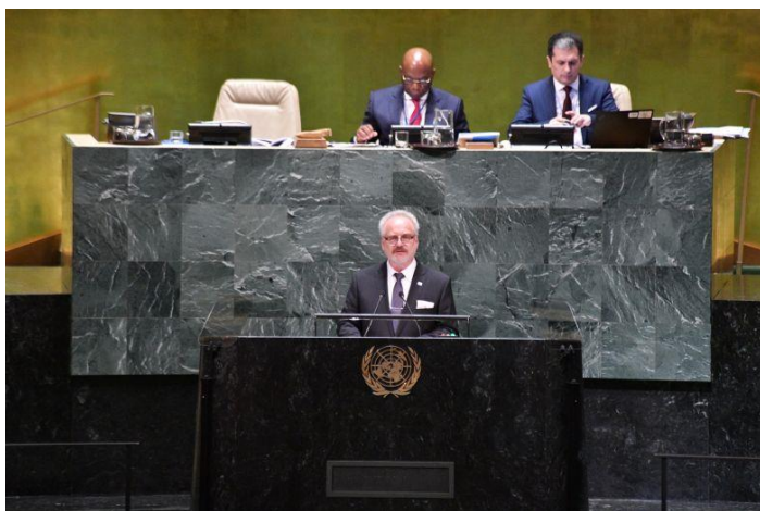
Latvijas Valsts prezidents Egils Levits ANO Ģenerālās asamblejas 74. sesijā.

Turpinās darbs, lai veicinātu Latvijas ievēšanu ANO Drošības padomē 2025. gadā uz 2026.-2027. gada termiņu. Izmantojot tuvojošos ANO 75. gadskārtu, Latvijā tika aktualizētas ANO aktuālas tēmas un veicināta izpratne par daudzpusējās sadarbības jeb multilaterālisma nozīmi un globālajiem izaicinājumiem. 2019. gada septembrī Latvija pievienojās “Multilaterālisma stiprināšanas aliansei”. Latvijas atbalstu multilaterālisma stiprināšanai, aktīvai rīcībai klimata pārmaiņu mazināšanā un globālo ilgtspējīgas attīstības mērķu sasniegšanā apstiprināja Latvijas Valsts prezidents Egils Levits ANO Ģenerālās asamblejas 74. sesijā.