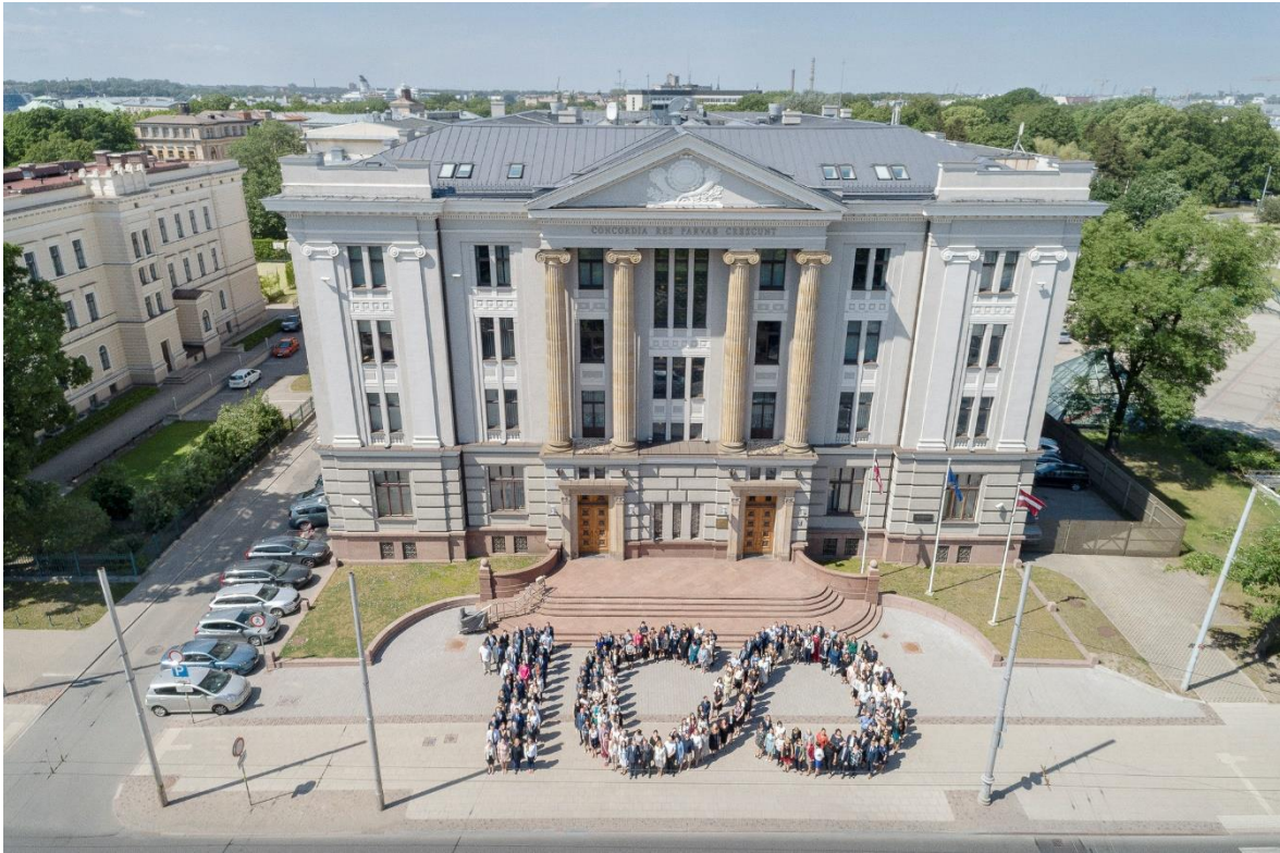
Kopbildē Latvijas Ārlietu dienesta darbinieki, godinot dienesta simtgadi.

Latvijas Ārlietu ministrijas, diplomātu un konsulāro darbinieku veikums sabiedrībai nereti ir maz zināms un izprotams, lai gan Latvijas ārējās drošības un labklājības vārdā ārlietu dienesta darbiniekiem bieži vien ir jāpieņem drosmīgi lēmumi. Tāpēc, lai atzīmētu Latvijas ārlietu dienesta simtgadi, Ārlietu ministrija īstenoja projektu “Ārlietu dienesta simtgades video stāsti: vīzija, vērtības un personības.” Atskatoties uz Latvijas ārlietu dienesta darbības pirmajiem simts gadiem, ministrija ar vairāku īsu video stāstu sēriju atklāja būtiskākos Latvijas valstiskuma un ārlietu dienesta veidošanās vēsturiskos notikumus, vienlaikus pievērsoties spilgtākajām personībām un izceļot dienesta vīziju un vērtības.