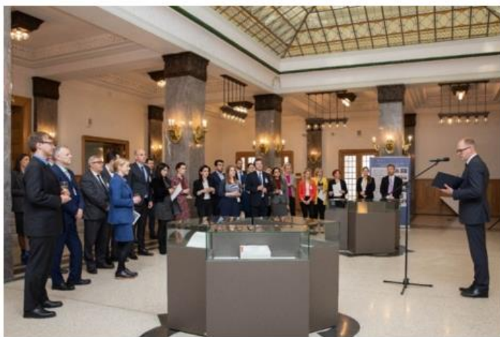
Latvijas prezidentūras Ieroču tirdzniecības nolīgumā seminārs Centrālās un Austrumeiropas eksporta kontroles pārstāvjiem.