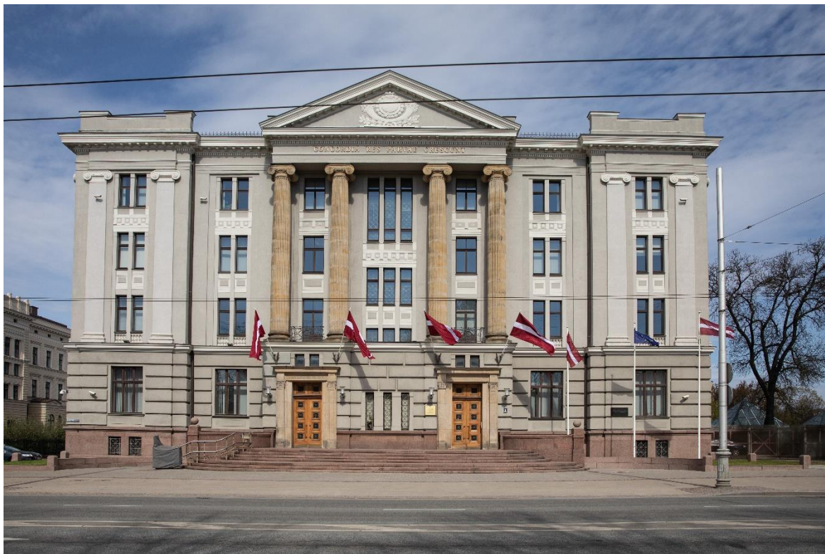
Ārlietu ministrijas ēka.