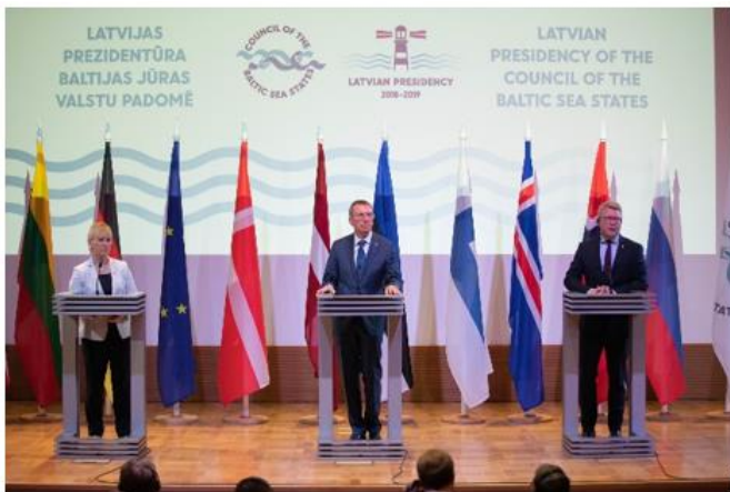
Latvijas prezidentūras BJVP noslēguma sanāksme Jūrmalā.