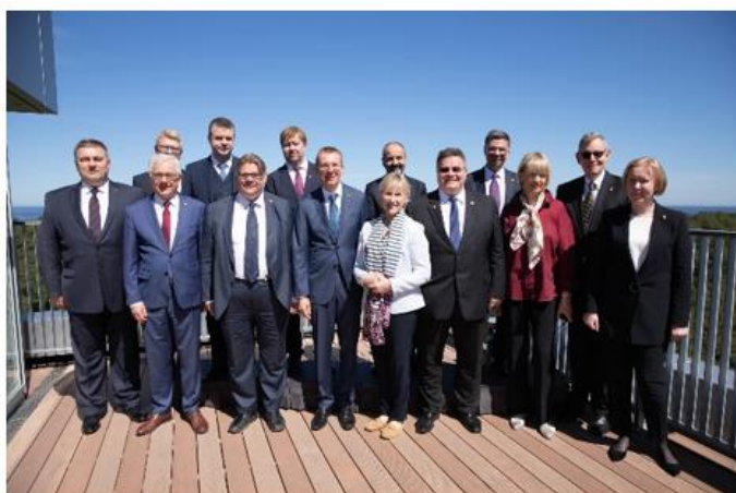
Latvijas prezidentūras BJVP noslēguma sanāksme Jūrmalā.

Kopumā 2019. gadā ir veiktas obligātās iemaksas 23 starptautiskās organizācijās. Ikgadējā iemaksa Reģionālās sadarbības padomē (RCC) 50 000,00 EUR apmērā.