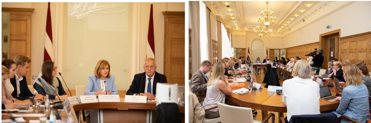
Diasporas konsultatīvās padomes pirmā sēde.

Saskaņā ar Diasporas likumu, kurš stājās spēkā 2019. gada 1. janvārī, Ārlietu ministrija ir kļuvusi par diasporas politikas koordinējošo valsts institūciju. 2019. gadā sāka darboties Diasporas konsultatīvā padome. Ir notikušas 3 padomes sēdes. Tika uzsākts darbs pie Plāna darbam ar diasporu 2021.-2023. gadam.