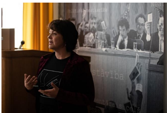
Īsfilmas #ActBalticWay prezentācija Tautas frontes muzejā 2019. gada 19. augustā.

Sākot no 2019. gada augusta līdz gada beigām ar simtgades finansējumu īstenotie projekti nesuši pozitīvu pievienoto vērtību Latvijas Institūta darbībai. Augustā īstenota kampaņa Act Baltic way par godu Baltijas ceļa 30 gadadienai. LI veidotā īsfilma #ActBalticWay bija skatāma Baltijas ceļa 30 gadadienas pasākumos visā pasaulē, sasniedzot ļoti plašu auditoriju un ārvalstu publicitāti arī virtuālajā vidē. Tika izdota faktu lapa par Baltijas ceļu, uzņemti 9 žurnālisti. Filma rosina vērtēt, kā "Baltijas ceļš" darbotos šodien – politikā, sadzīvē, attiecībās un citur. Latvijas, Igaunijas un Lietuvas cilvēku mierpilnā, bet mērķtiecīgā sadošanās rokās atbildīgā un nevardarbīgā veidā, pievērša pasaules uzmanību Baltijas valstu