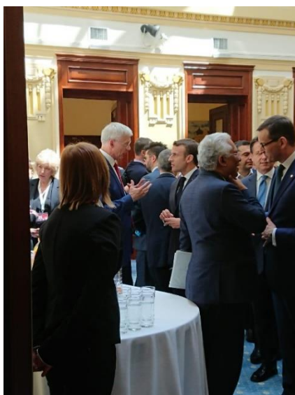
Ministru prezidents Arturs Krišjānis Kariņš 2019.gada 9.maijā (Eiropas diena) Sibiu samītā ar Francijas prezidentu Emanuelu Makronu par klimata jautājumiem.

Ekonomikas un sabiedrības digitalizācija kļūst par aizvien aktuālāku Eiropas Savienības dienaskārtības jautājumu. Jaunā Eiropas Komisija apņēmusies nodrošināt, ka Eiropas Savienība ir gatava digitālo tehnoloģiju laikmetam un veiksmīgi īsteno pāreju uz modernāko digitālo tehnoloģiju un pakalpojumu plašāku pielietojumu.