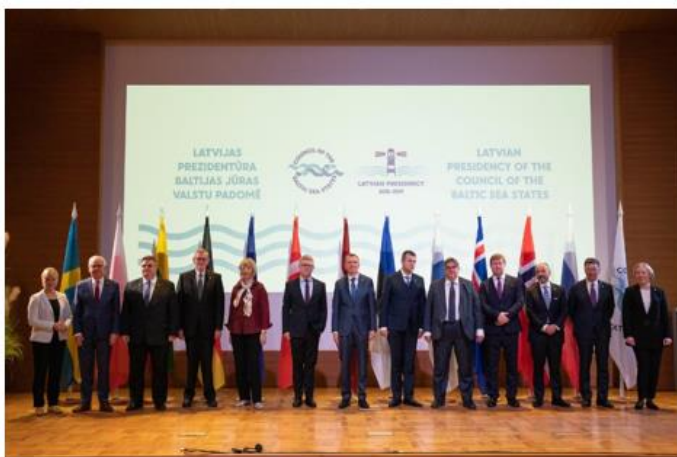
Latvijas prezidentūras BJVP noslēguma sanāksme Jūrmalā.