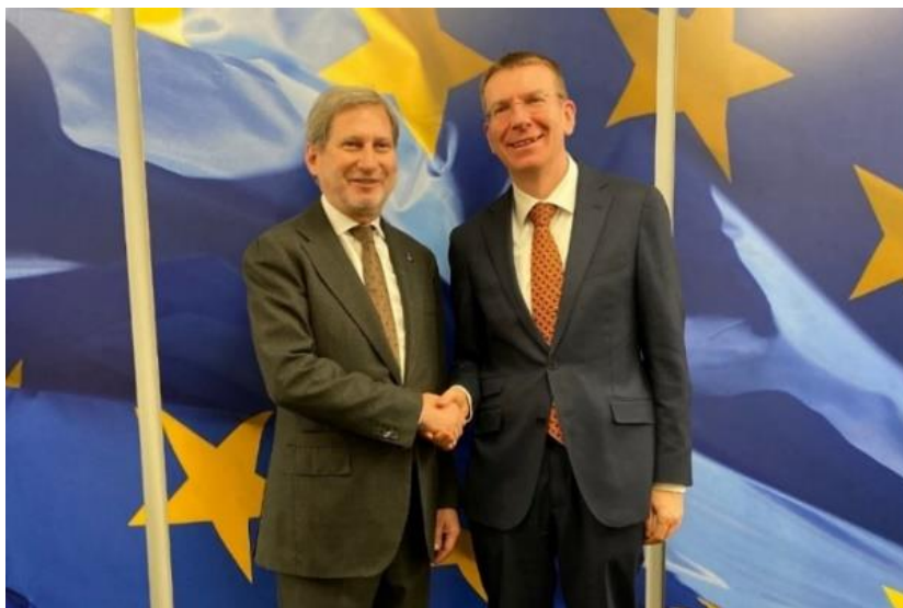
2020. gada 28. janvārī Latvijas ārlietu ministrs Edgars Rinkēvičs un Eiropas Komisijas Budžeta un administrācijas komisārs Johaness Hāns (Johannes Hahn) Briselē pārrunā nākamā perioda ES daudzgadu budžeta piedāvājumu.

2019. gadā turpinājās sarunas par ES daudzgadu budžetu 2021.-2027. gadam. Ārlietu ministrijas amatpersonas un eksperti turpināja aizstāvēt Latvijas intereses – atbilstošu Kohēzijas politikas finansējumu, godīgu lauksaimniecības finansējuma sadali un ES atbalstu Rail Baltica projektam - ES institūcijās, tiekoties ar Eiropas Komisijas un Eiropas Parlamenta pārstāvjiem, dažādu formātu sanāsmēs ar dalībvalstīm, kā arī piedaloties ES līmeņa darba grupās. Tika uzturēta aktīva un cieša sadarbība ar līdzīgi domājošām valstīm, īpaši ar pārējām Baltijas valstīm. Ārlietu ministrijas amatpersonas ir pārstāvējušas Latviju t.s. Kohēzijas draugu grupā, kas iestājas par adekvāta finansējuma nodrošināšanu Kohēzijas politikai. Gaidāms, ka sarunas par ES daudzgadu budžetu noslēgsies 2020. gada otrajā pusē.